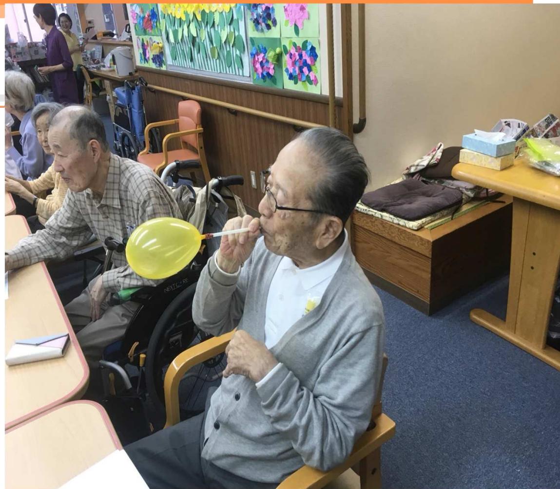
社区日托中心的游戏活动